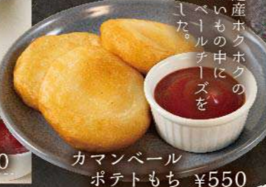
カマンベールポテトもち ¥550