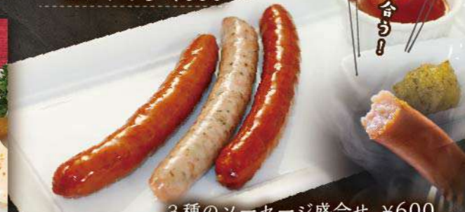
3種のソーセージ盛合せ ¥600