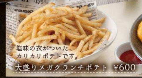
塩味の衣がついたカリカリポテトです。大盛りメガランチポテト ¥600